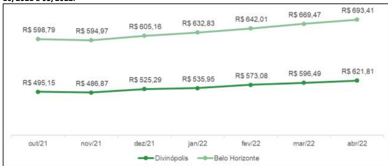
Gráfico 2: Comparativo da evolução dos valores (R$) da cesta básica em Belo Horizonte e Divinópolis-10/2021 a 03/2022.

Em abril/2022 observou-se uma variação de 11,5% no custo da cesta básica entre as duas cidades com um impacto maior no orçamento do trabalhador residente na capital mineira.