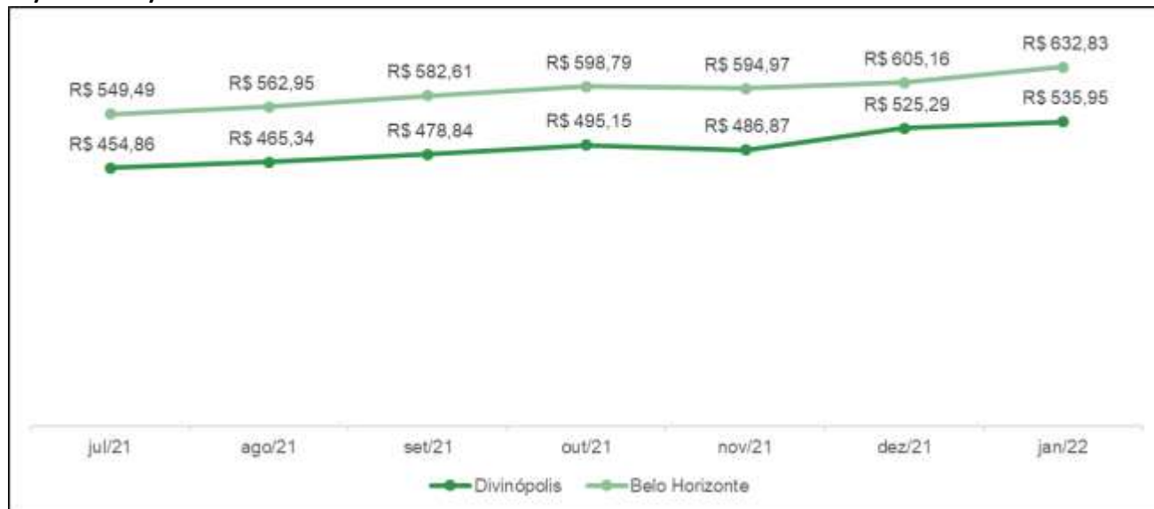
Gráfico 2: Comparativo da evolução dos valores (R$) da cesta básica em Belo Horizonte e Divinópolis-07/2021 a 01/2022.

Em janeiro/2022 observou-se uma variação de 18,1% no custo da cesta básica entre as duas cidades com um impacto maior no orçamento do trabalhador residente na capital mineira.