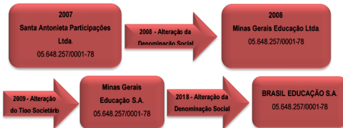
Figura 1 - Evolução do Tipo Societário da Mantenedora

A Brasil Educação S/A, Pessoa Jurídica de Direito Privado com Fins Lucrativos - Sociedade Anônima, sob CNPJ nº 05.648.257/0001-78, com sede e foro na cidade de Belo Horizonte, conforme Estatuto Social consolidado e registrado na NIRE do estado de Minas Gerais sob o nº 31300093166, registro 6343145, em 24 de outubro de 2017, mantém de várias instituições de ensino superior no estado de Minas Gerais. A Brasil Educação foi criada em 08/05/2003 como Santa Antonieta Participações Ltda. e foi evoluindo, conforme figura abaixo: