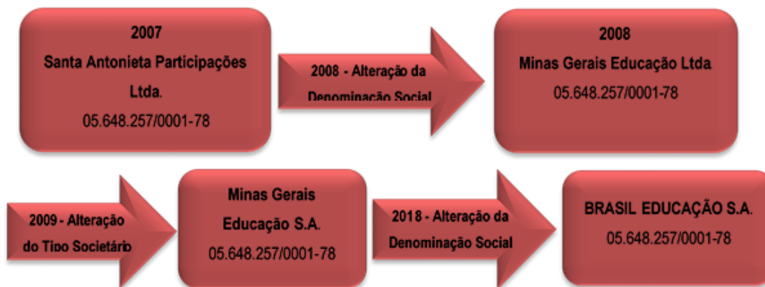
Figura 1 - Evolução do Tipo Societário da Mantenedora

A Brasil Educação S/A, Pessoa Jurídica de Direito Privado com Fins Lucrativos - Sociedade Anônima, sob CNPJ nº 05.648.257/0001-78, com sede e foro na cidade de Belo Horizonte, conforme Estatuto Social consolidado e registrado na NIRE do estado de Minas Gerais sob o nº 31300093166, registro 6343145, em 24 de outubro de 2017, mantém de várias instituições de ensino superior no estado de Minas Gerais. A Brasil Educação foi criada em 08/05/2003 como Santa Antonieta Participações Ltda. e foi evoluindo, conforme figura abaixo: