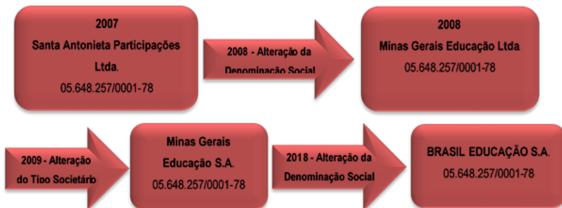
Figura 1 - Evolução do Tipo Societário da Mantenedora

A Brasil Educação S/A, Pessoa Jurídica de Direito Privado com Fins Lucrativos - Sociedade Anônima, sob CNPJ nº 05.648.257/0001-78, com sede e foro na cidade de Belo Horizonte, conforme Estatuto Social consolidado e registrado na NIRE do estado de Minas Gerais sob o nº 31300093166, registro 6343145, em 24 de outubro de 2017, mantém de várias instituições de ensino superior no estado de Minas Gerais. A Brasil Educação foi criada em 08/05/2003 como Santa Antonieta Participações Ltda. e foi evoluindo, conforme figura abaixo: