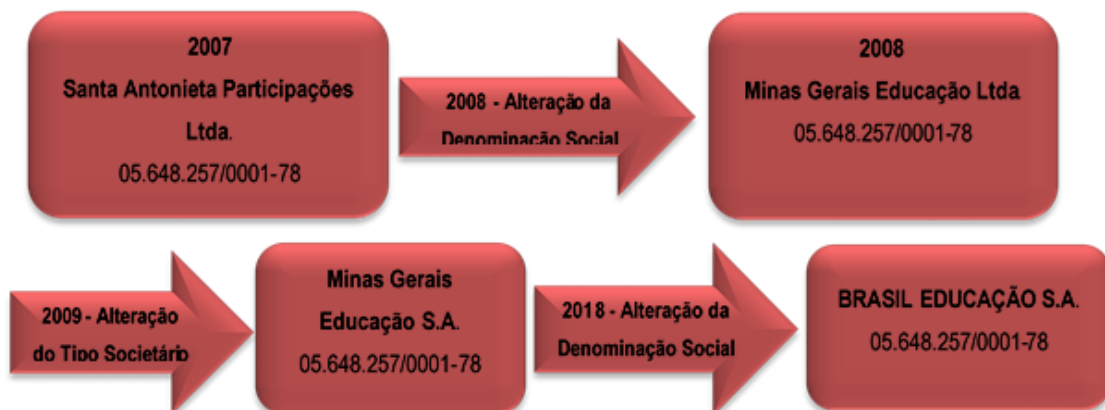
Figura 1 - Evolução do Tipo Societário da Mantenedora

A Brasil Educação S/A, Pessoa Jurídica de Direito Privado com Fins Lucrativos - Sociedade Anônima, sob CNPJ nº 05.648.257/0001-78, com sede e foro na cidade de Belo Horizonte, conforme Estatuto Social consolidado e registrado na NIRE do estado de Minas Gerais sob o nº 31300093166, registro 6343145, em 24 de outubro de 2017, mantém de várias instituições de ensino superior no estado de Minas Gerais. A Brasil Educação foi criada em 08/05/2003 como Santa Antonieta Participações Ltda. e foi evoluindo, conforme figura abaixo: