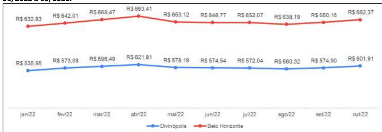
Gráfico 2: Comparativo da evolução dos valores (R$) da cesta básica em Belo Horizonte e Divinópolis-01/2022 a 10/2022.

Em outubro/2022 observou-se uma variação de 10,04% no custo da cesta básica entre as duas cidades com um impacto maior no orçamento do trabalhador residente na capital mineira.