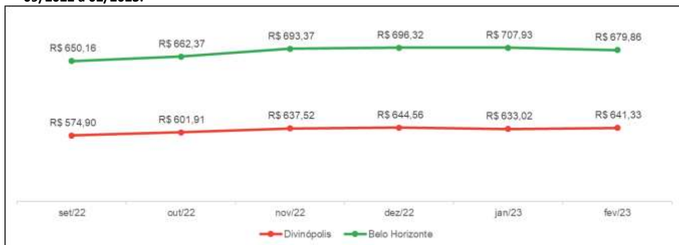
Gráfico 2: Comparativo da evolução dos valores (R$) da cesta básica em Belo Horizonte e Divinópolis-09/2022 a 02/2023.

Em fevereiro/2023 observou-se uma variação de 6% no custo da cesta básica entre as duas cidades com um impacto maior no orçamento do trabalhador residente na capital mineira.