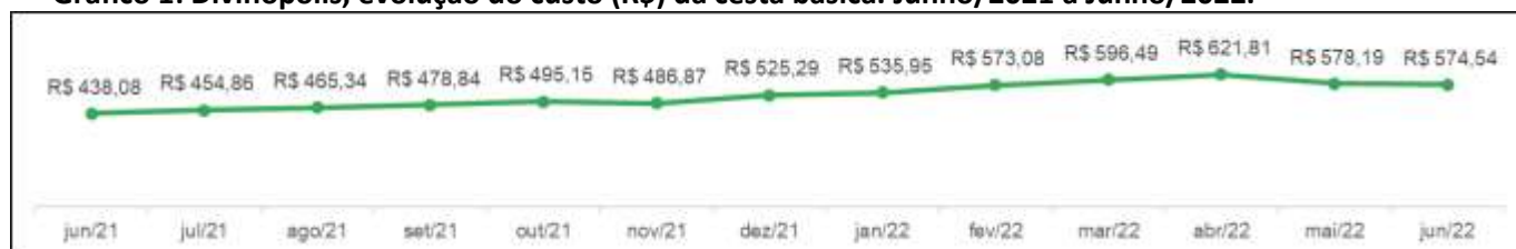
Gráfico 1: Divinópolis, evolução do custo (R$) da cesta básica. Junho/2021 a Junho/2022.

O Gráfico 2 traz a comparação dos valores da cesta básica da capital Belo Horizonte, divulgada pelo Dieese, com os valores observados em Divinópolis.