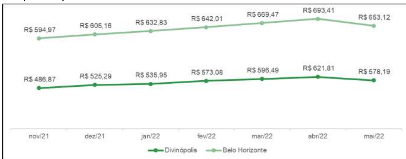
Gráfico 2: Comparativo da evolução dos valores (R$) da cesta básica em Belo Horizonte e Divinópolis-11/2021 a 05/2022.

Em maio/2022 observou-se uma variação de 12,9% no custo da cesta básica entre as duas cidades com um impacto maior no orçamento do trabalhador residente na capital mineira.