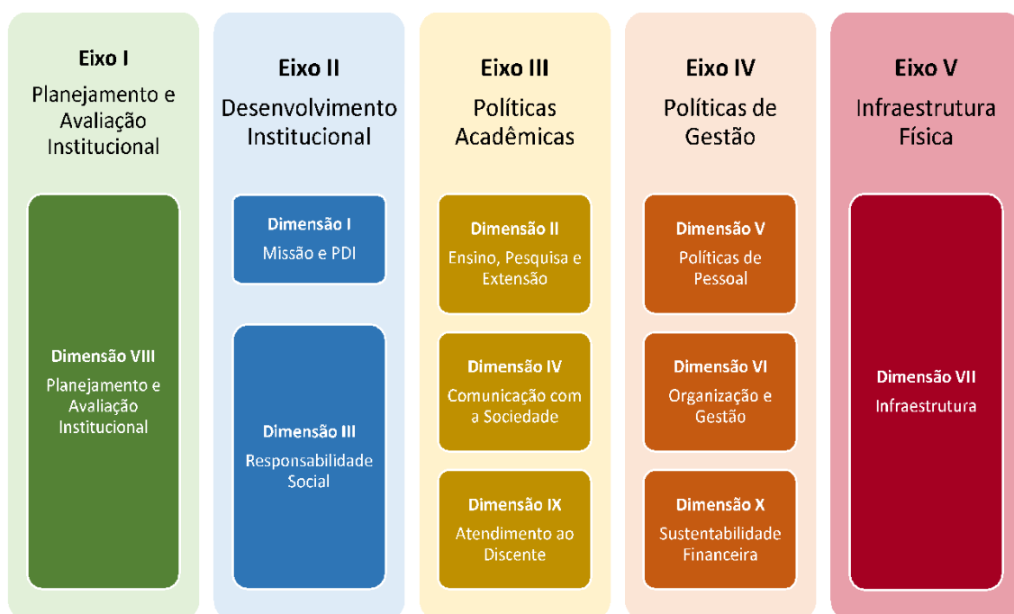
Figura 2 – Eixos e dimensões do SINAES

Essa autoavaliação, realizada em todos os cursos da IES, a cada semestre, de forma quantitativa e qualitativa, atenderá à Lei do Sistema Nacional de Avaliação da Educação Superior (SINAES), nº 10.8601, de 14 de abril de 2004. A legislação irá prever a avaliação de dez dimensões, agrupadas em 5 eixos, conforme ilustra a figura a seguir.