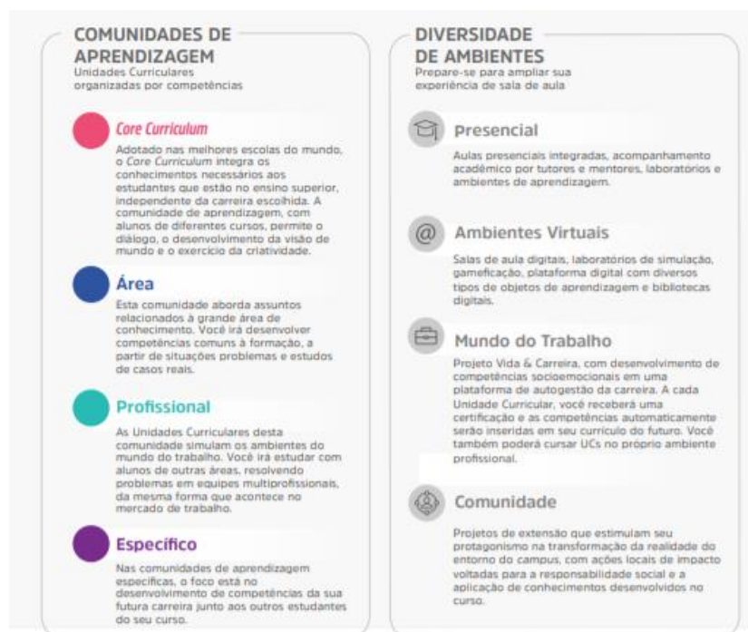
Figura 1 – Comunidades de aprendizagem e diversidade de ambientes

A flexibilidade do Currículo Integrado por Competências permite ao estudante transitar por diferentes comunidades de aprendizagem alinhadas aos seus respectivos eixos de formação. O percurso formativo é flexível, fluído, e ao final de cada unidade curricular o aluno atinge as competências de acordo com as metas de compreensão estudadas e vivenciadas ao longo do semestre.