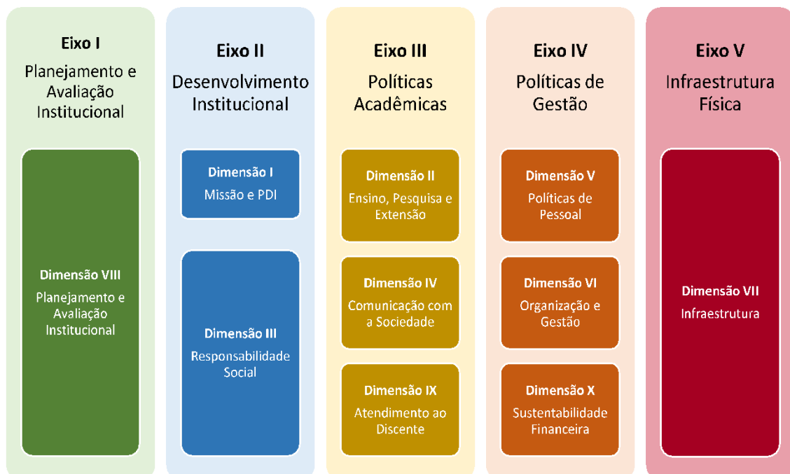
Figura 2 – Eixos e dimensões do SINAES

Essa autoavaliação, realizada em todos os cursos da IES, a cada semestre, de forma quantitativa e qualitativa, atenderá à Lei do Sistema Nacional de Avaliação da Educação Superior (SINAES), nº 10.8601, de 14 de abril de 2004. A legislação irá prever a avaliação de dez dimensões, agrupadas em 5 eixos, conforme ilustra a figura a seguir.