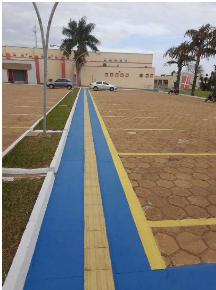
Pintura estacionamento do Administrativo