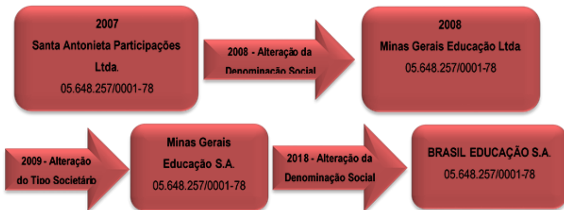
Figura 1 - Evolução do Tipo Societário da Mantenedora

A Brasil Educação S/A, Pessoa Jurídica de Direito Privado com Fins Lucrativos - Sociedade Anônima, sob CNPJ nº 05.648.257/0001-78, com sede e foro na cidade de Belo Horizonte, conforme Estatuto Social consolidado e registrado na NIRE do estado de Minas Gerais sob o nº 31300093166, registro 6343145, em 24 de outubro de 2017, mantém de várias instituições de ensino superior no estado de Minas Gerais. A Brasil Educação foi criada em 08/05/2003 como Santa Antonieta Participações Ltda. e foi evoluindo, conforme figura abaixo: