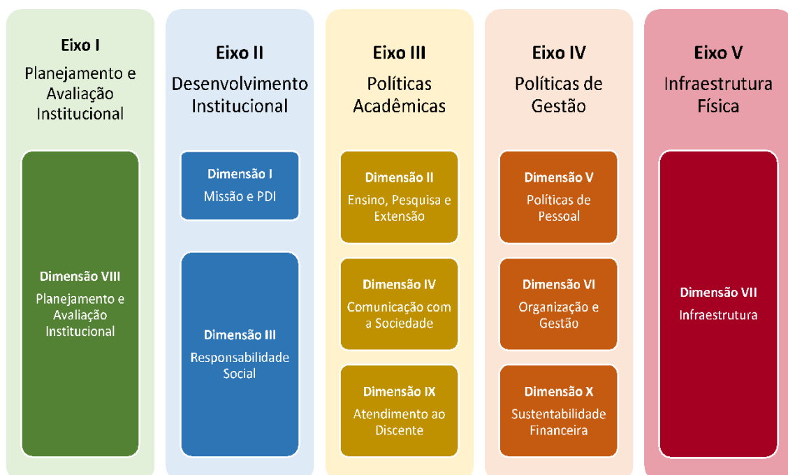
Figura 2 – Eixos e dimensões do SINAES

Essa autoavaliação, realizada em todos os cursos da IES, a cada semestre, de forma quantitativa e qualitativa, atenderá à Lei do Sistema Nacional de Avaliação da Educação Superior (SINAES), nº 10.8601, de 14 de abril de 2004. A legislação irá prever a avaliação de dez dimensões, agrupadas em 5 eixos, conforme ilustra a figura a seguir.