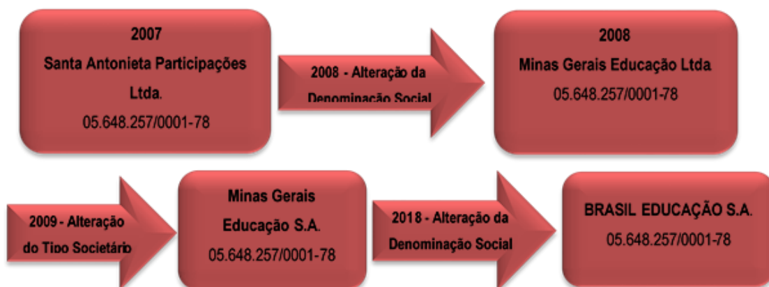
Figura 1 - Evolução do Tipo Societário da Mantenedora

A Brasil Educação S/A, Pessoa Jurídica de Direito Privado com Fins Lucrativos - Sociedade Anônima, sob CNPJ nº 05.648.257/0001-78, com sede e foro na cidade de Belo Horizonte, conforme Estatuto Social consolidado e registrado na NIRE do estado de Minas Gerais sob o nº 31300093166, registro 6343145, em 24 de outubro de 2017, mantém de várias instituições de ensino superior no estado de Minas Gerais. A Brasil Educação foi criada em 08/05/2003 como Santa Antonieta Participações Ltda. e foi evoluindo, conforme figura abaixo: